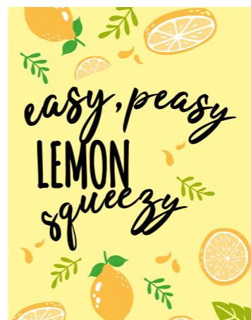
KÜHLSCHRANKMAGNET von pedagrafie

Gelb bedeutet Leuchten, Strahlen, die Sonne und das Licht. Die Farbe steht für Heiterkeit und Optimismus. Hier kommt eine Extra-Portion gute Laune!