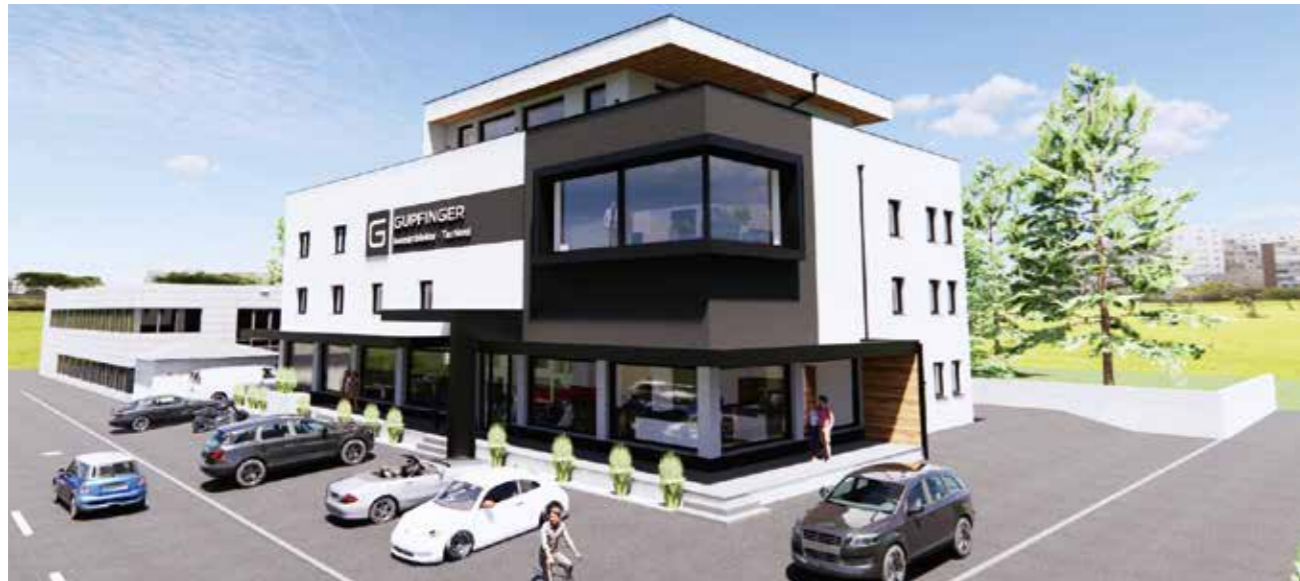
GUPFINGER Einrichtungstudio GmbH, Linzer Str. 37, A-4780 Schärading, Tel: +43 (0) 7712-3261, office@gupfinger.at, www.gupfinger.at