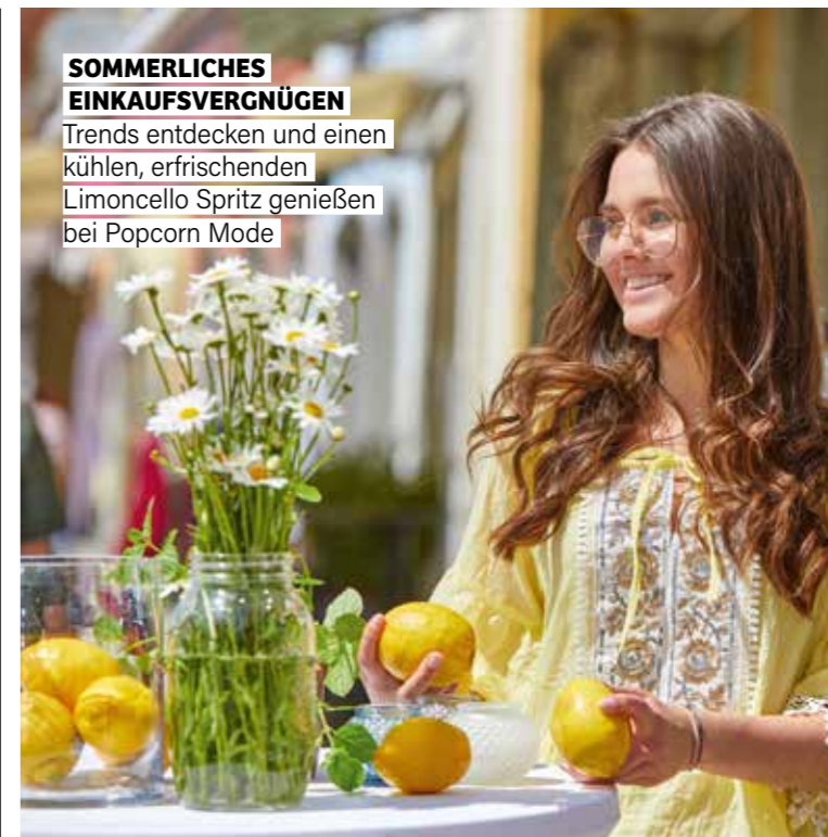
SOMMERLICHES EINKAUFsvergnügen Trends entdecken und einen kühlen, erfrischenden Limoncello Spritz genießen bei Popcorn Mode