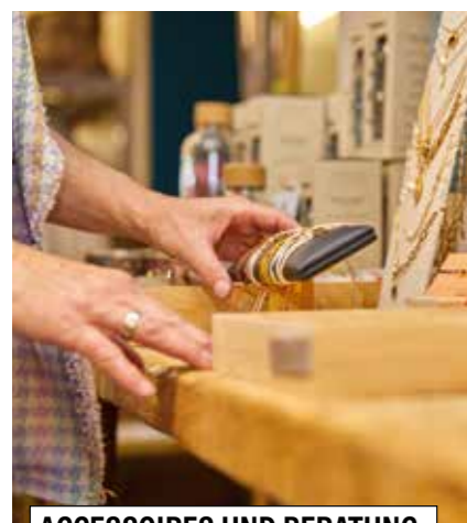
ACCESSOIRES UND BERATUNG

Vereinbaren Sie einen Termin unter +43 (0)7712 / 3367