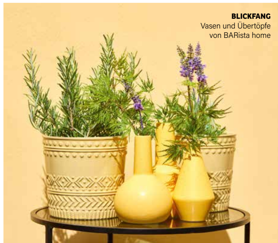
BLICKFANG Vasen und Übertöpfe von BARista home