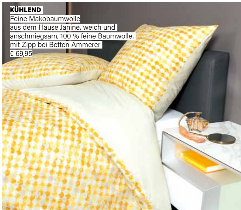
KÜHLEND Feine Makobaumwolle aus dem Hause Janine, weich und anschmiegsam, 100 % feine Baumwolle, mit Zipp bei Betten Ammerer € 69,95