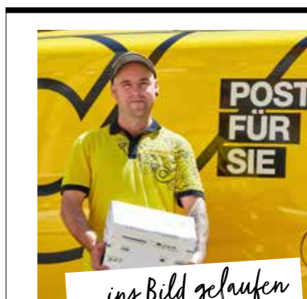
... ins Bild gelaufen