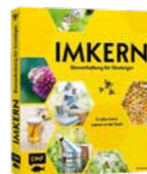
BUCHTIPP "Imkern" ein reich bebildertes und informatives Einsteigerbuch: € 20,60- erhältlich in der Buch- handlung Josef Heindl