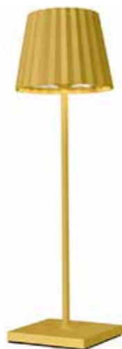
STRAHLEND SOMPEX Akku LED Lampe, wasserfest, viele Farben: € 129,- erhältlich bei Schreibwaren & Geschenke Josef Heindl

Gelb bedeutet Leuchten, Strahlen, die Sonne und das Licht. Die Farbe steht für Heiterkeit und Optimismus. Hier kommt eine Extra-Portion gute Laune!