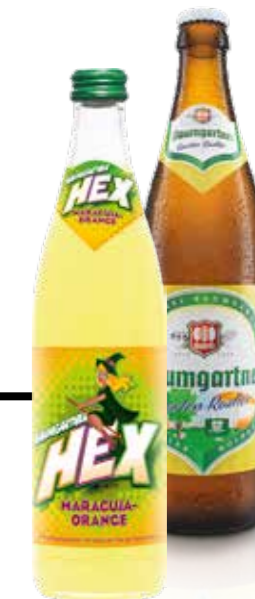
DURSTLÖSCHER Ideal an heißen Tagen - die fruchtig-frische Schärding Hex oder der leichte Radler der Bauerei Baumgartner