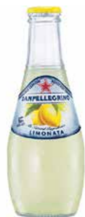
ERFRISCHEND San Pellegrino Limonata BIO Limonade aus sizilianischen Zitronen € 2,50 genießen im Lesecafé Josef Heindl