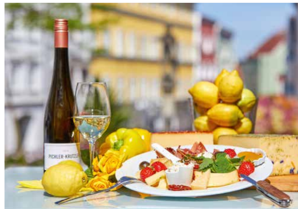
SOMMERFEELING Feine mediterrane Jause und ein Glas herrlicher Riesling (oder auch ein Flascherl) genießen im Vino Schärding